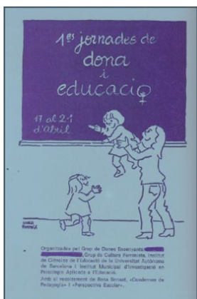
1978 Primeres Jornades de Dona i Educació

Hay que reseñar el dato de que las universidades del Estado no tuvieron una respuesta inmediata desde posicionamientos feministas teóricos potentes, accionados por el periodo de Transición; mucho menos para propuestas de escolaridad coeducativas. A excepción de Marina Subirats desde 1977, Tina Brullet y Montserrat Moreno en los ochenta, que empezaron muy pronto a trabajar la ciencia, el androcentrismo y el sexismo educativo, la respuesta tuvo que esperar a que el movimiento activista se consolidara en el grupo de mujeres enseñantes. Sobre esto, en 1978 se conformó un pequeño grupo universitario que denominó a su espacio Seminari d'Estudis de la Dona (SED) en el departamento de Sociología de la Autònoma de Barcelona, con Marina Subirats (coeducadora), Judith Astelarra y Teresa Torns como fundadoras, al